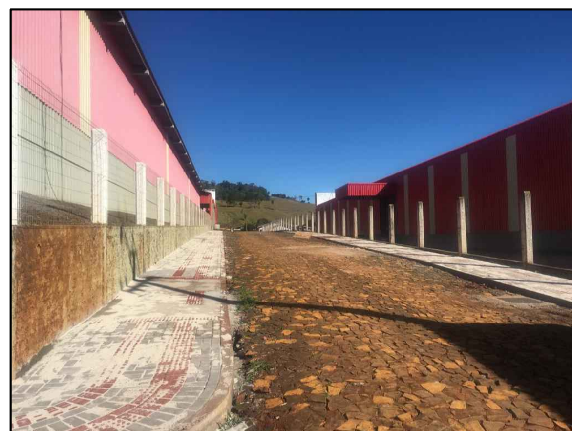
FORNTE: MUNICIPIO DE NOVA ESPERANÇA DO SUDOESTE

Trecho compreendido entre a Rua Terezinha Rohling Boger e a Rua Adolfo Silva Stang Escala: 1/250