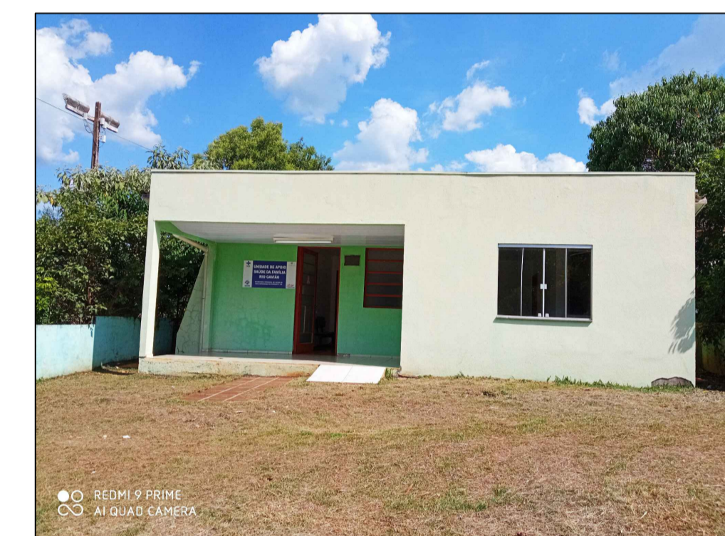
FORTE: MUNICÍPIO DE NOVA ESPERANÇA DO SUDOESTE