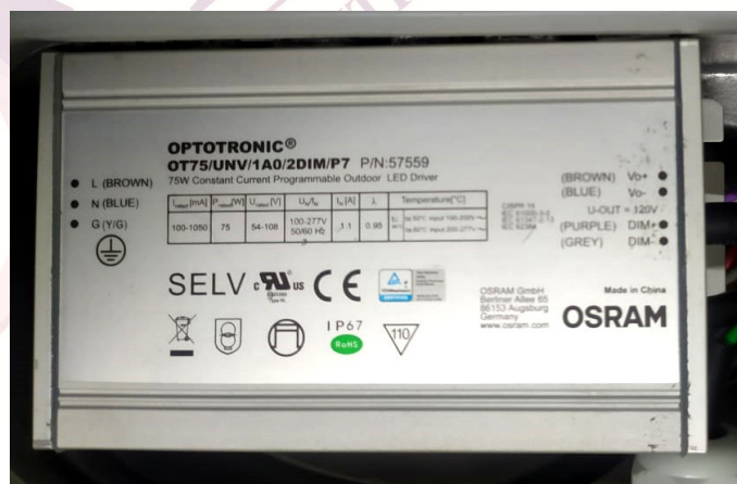
Fotografia 04 – Aspecto da amostra (Driver)

Os resultados apresentados no presente documento têm significação restrita e se aplicam somente ao objeto ensaiado ou calibrado. A sua reprodução, só poderá ser feita integralmente, reproduções parciais só poderão ser feita mediante a prévia autorização do laboratório emiteente.