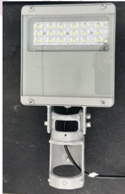
Fotografia 01 – Aspecto da amostra

Os resultados apresentados no presente documento têm significação restrita e se aplicam somente ao objeto ensaiado ou calibrado. A sua reprodução, só poderá ser feita integralmente, reproduções parciais só poderão ser feita mediante a prévia autorização do laboratório emiteente.