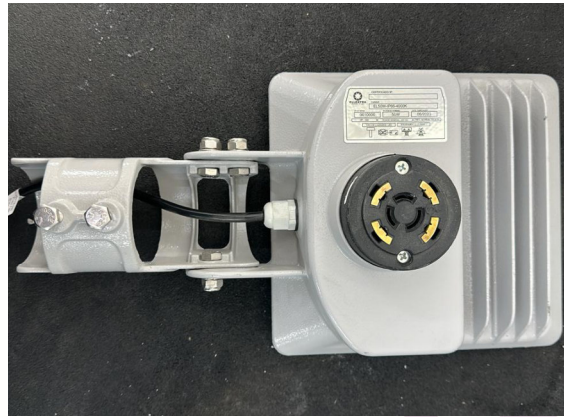
Fotografia 02 – Aspecto da amostra

Laboratório de Ensaio Acreditado pela CGCRE de acordo com ABNT NBR ISO/IEC 17025, sob o número CRL 0659