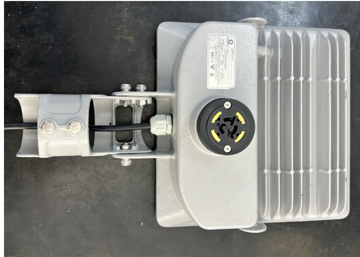
Fotografia 02 – Aspecto da amostra

Laboratório de Ensaio Acreditado pela CGCRE de acordo com ABNT NBR ISO/IEC 17025, sob o número CRL 0659