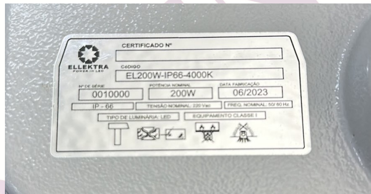
Fotografia 03 – Aspecto da amostra