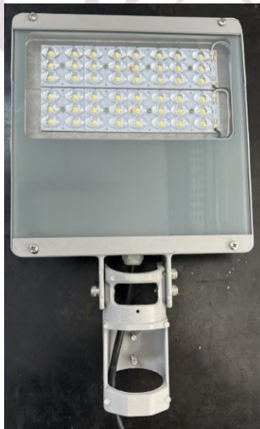
Fotografia 01 – Aspecto da amostra

Os resultados apresentados no presente documento têm significação restrita e se aplicam somente ao objeto ensaiado ou calibrado. A sua reprodução, só poderá ser feita integralmente, reproduções parciais só poderão ser feita mediante a prévia autorização do laboratório emissor.