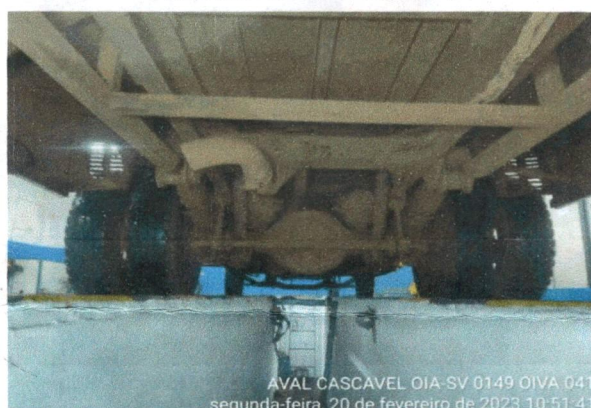
EIXO E PNEUS TRASEIROS DO VEÍCULO

AVAL CASCAVEL OIA-SV 0149 OIVA 041 segunda-feira, 20 de fevereiro de 2023 10:51:41