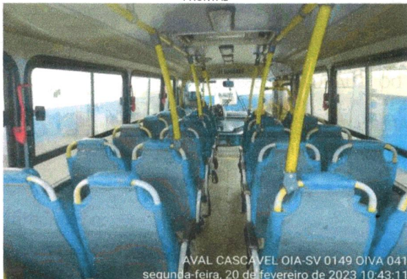
INTERIOR DO VEÍCULO, RETIRADA DA PARTE TRASEIRA PARA A PARTE FRONTAL

AVAL CASCAVEL OIA-SV 0149 OIVA 041 segunda-feira, 20 de fevereiro de 2023 10:43:11