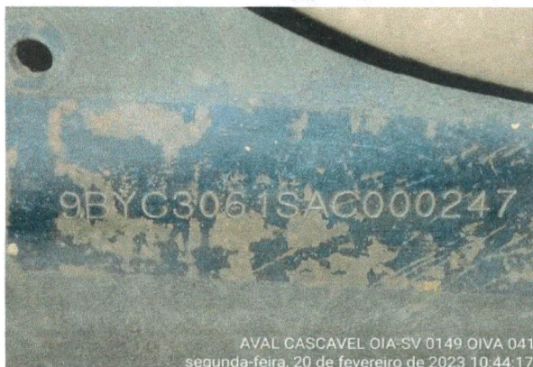
NUMERAÇÃO DO CHASSI

AVAL CASCAVEL OIA-SV 0149 OIVA 041 segunda-feira, 20 de fevereiro de 2023 10:44:17