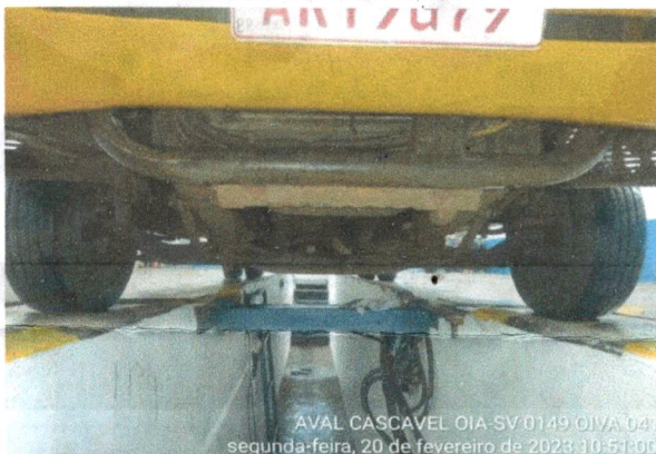
EIXO E PNEUS DIANTEIROS DO VEÍCULO

AVAL CASCAVEL OIA-SV 0149 OIVA 041 segunda-feira, 20 de fevereiro de 2023 10:51:09