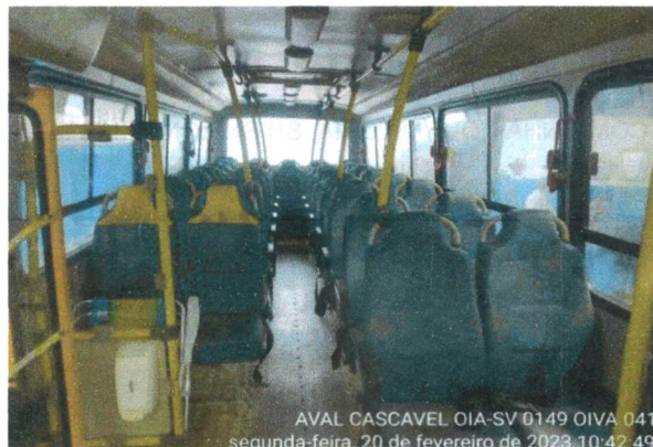
INTERIOR DO VEÍCULO, RETIRADA DA PARTE FRONTAL PARA A PARTE TRASEIRA

AVAL CASCAVEL OIA-SV 0149 OIVA 041 segunda-feira, 20 de fevereiro de 2023 10:42:49