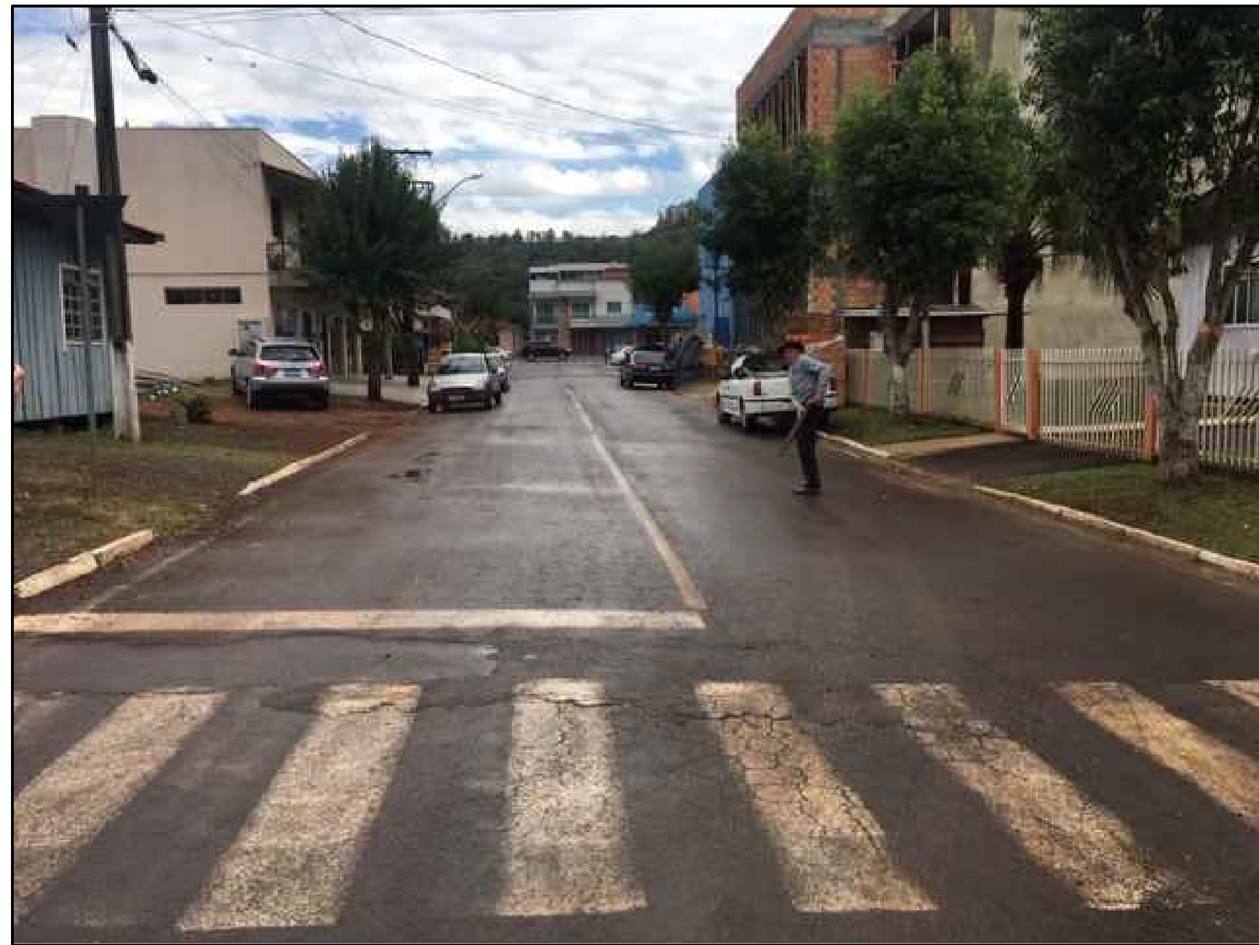
RUA HUMBERTO BACK