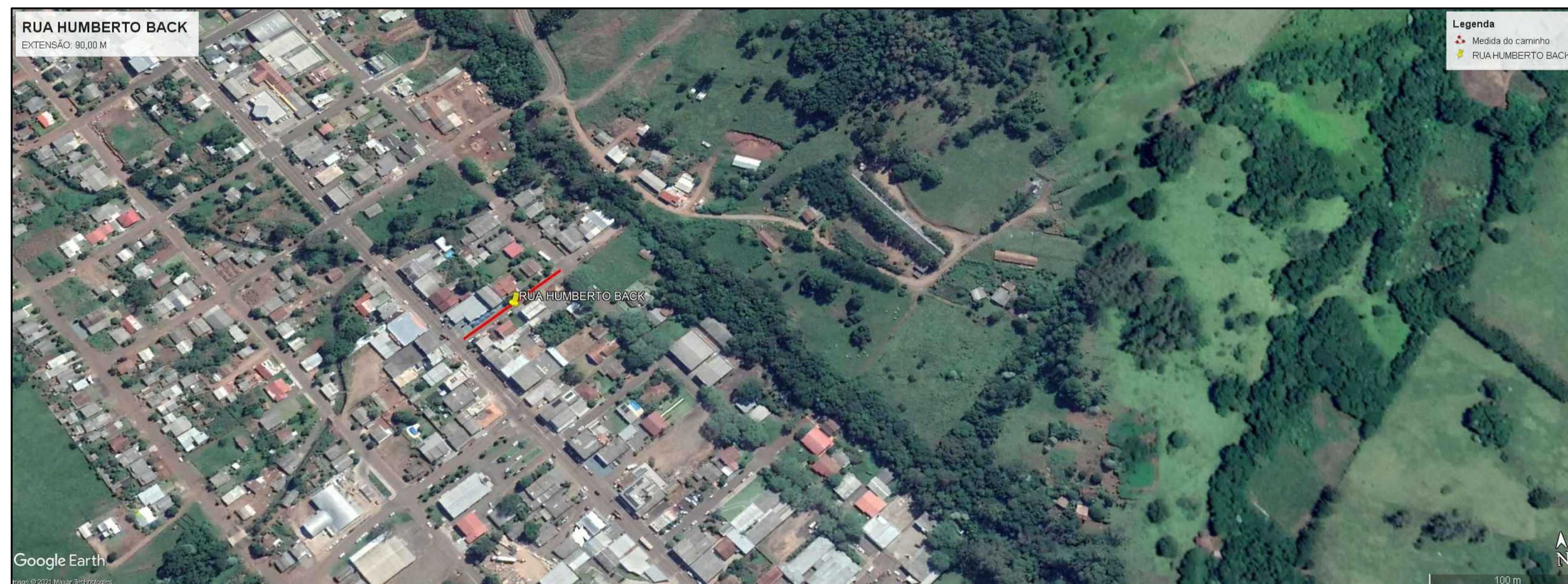
PLANTA DE LOCALIZAÇÃO Sem Escala