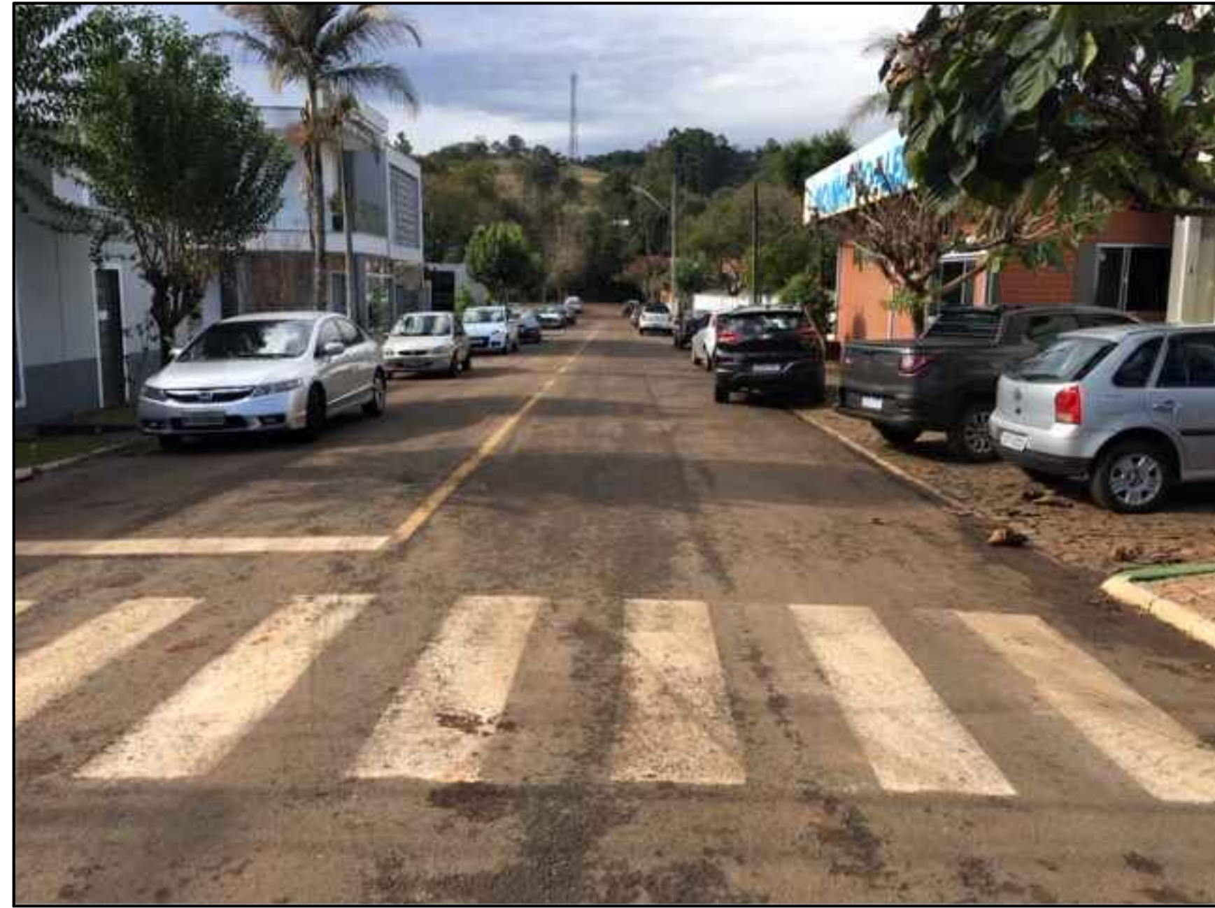
TRAVESSA RODOVIÁRIA