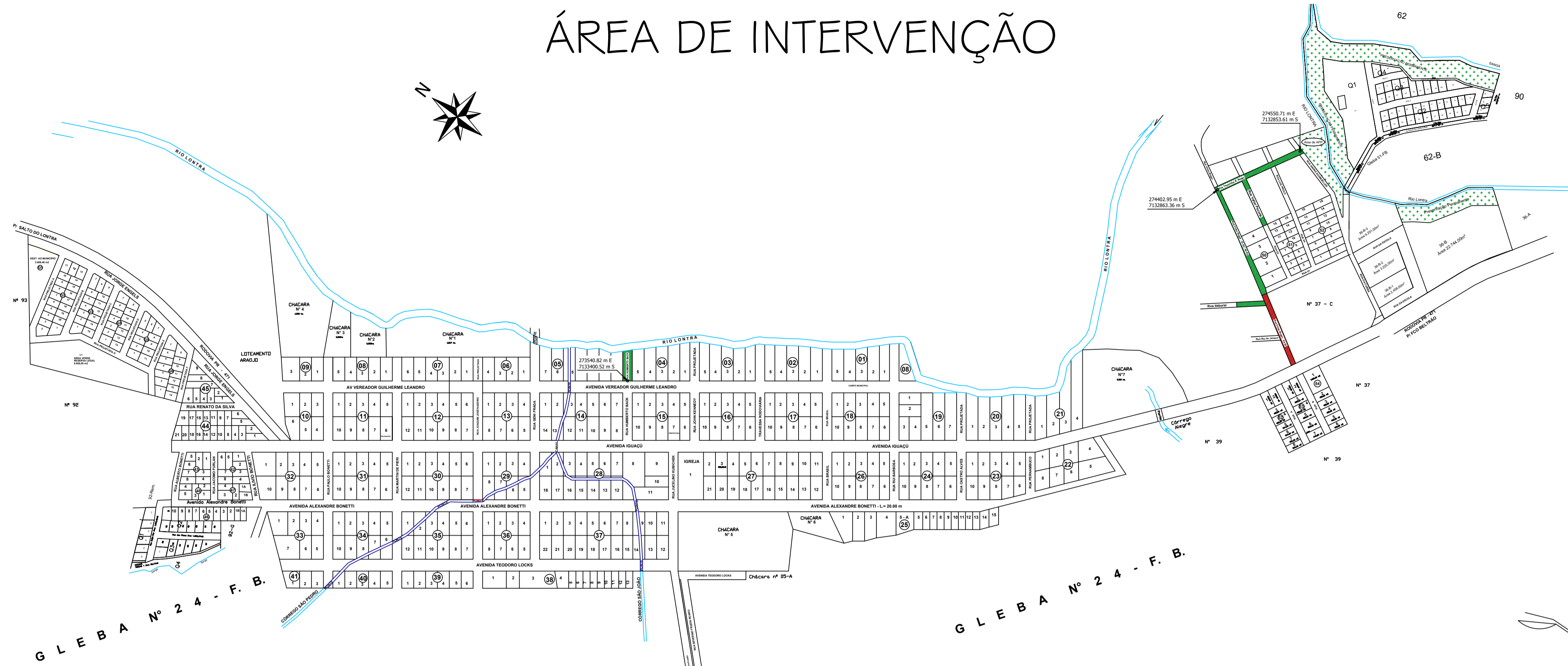
Planta de Localização Escala: 1/4000