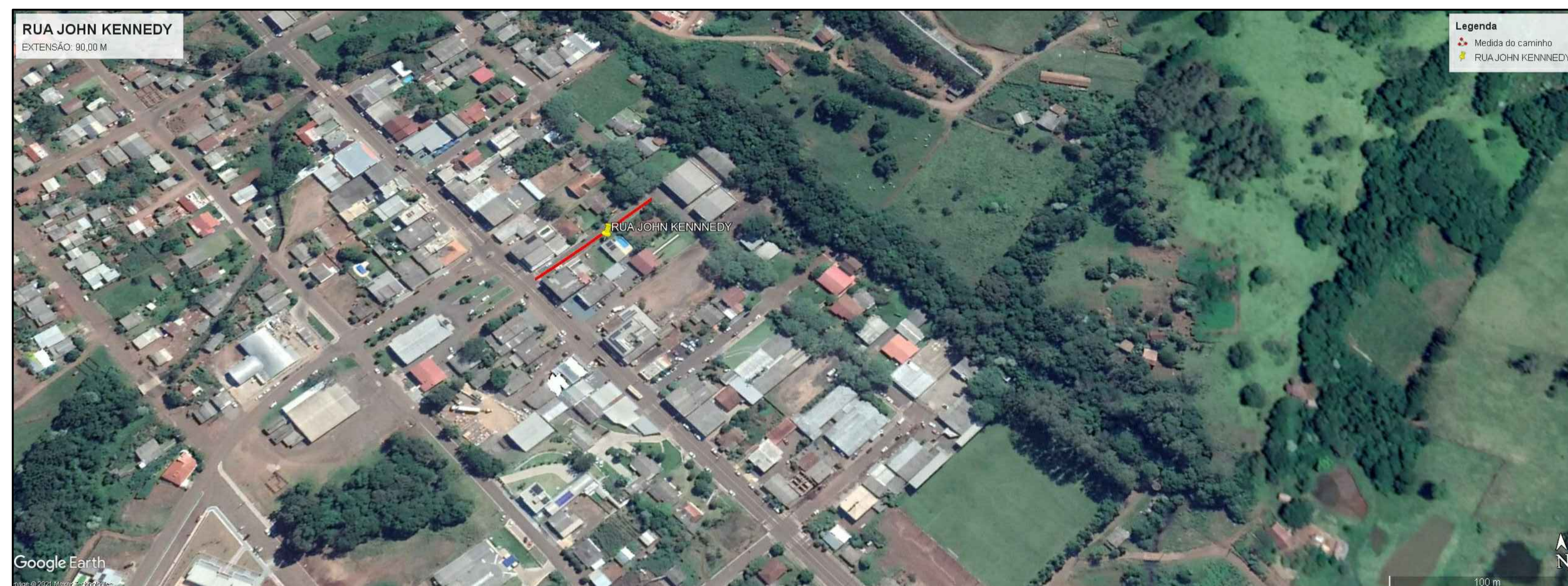
PLANTA DE LOCALIZAÇÃO Sem Escala