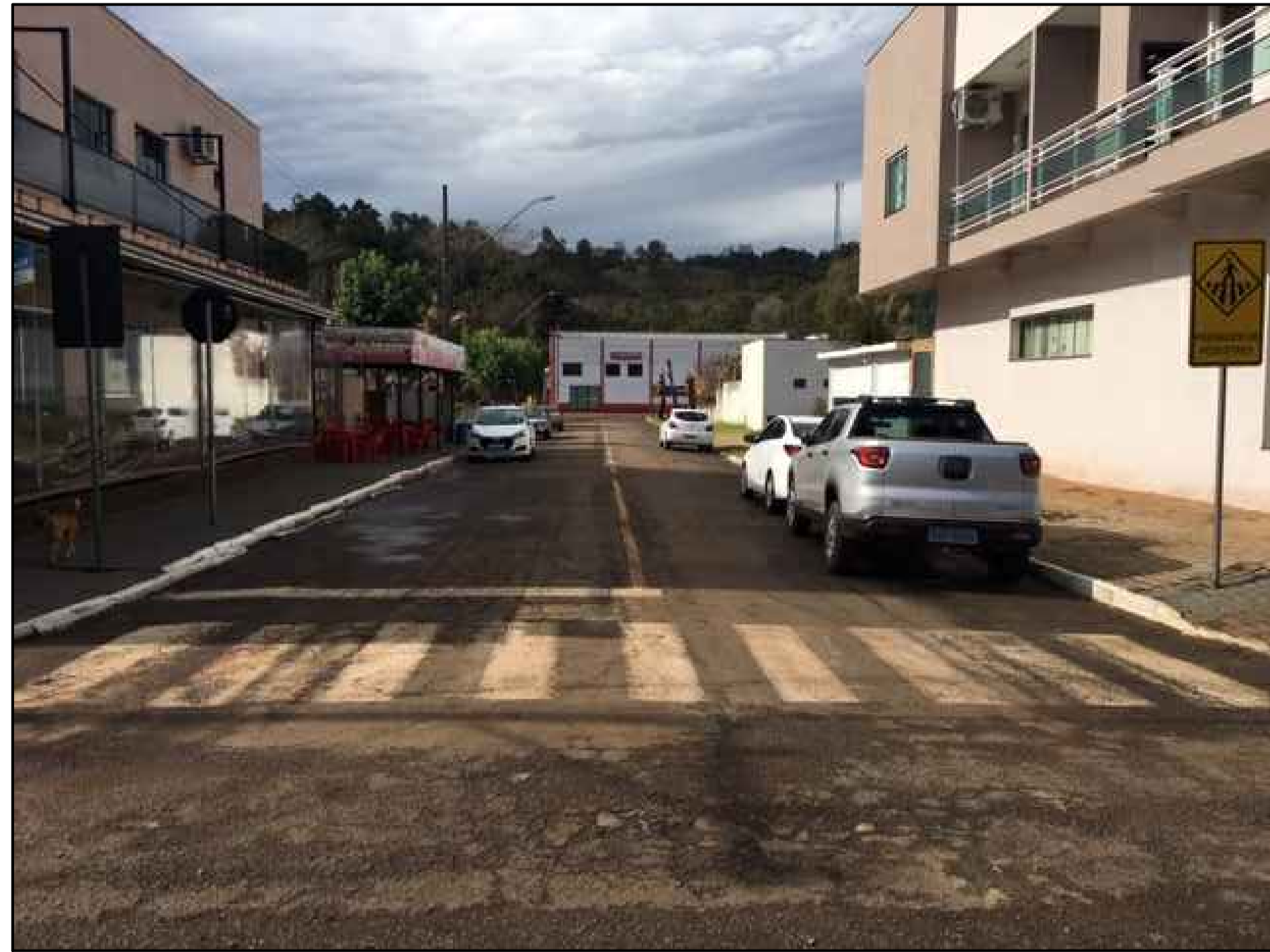
RUA JOHN KENNEDY