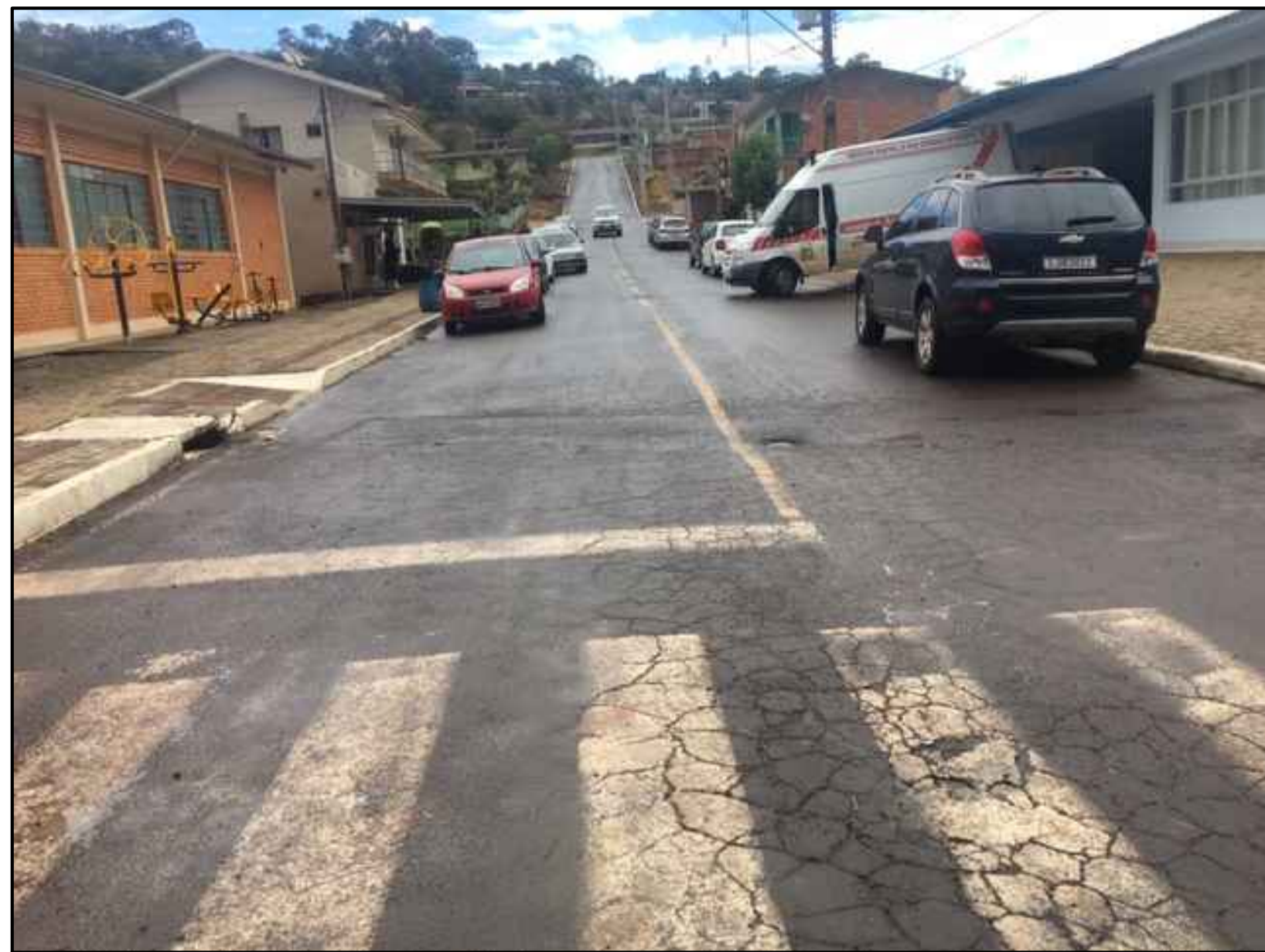
RUA BRASIL