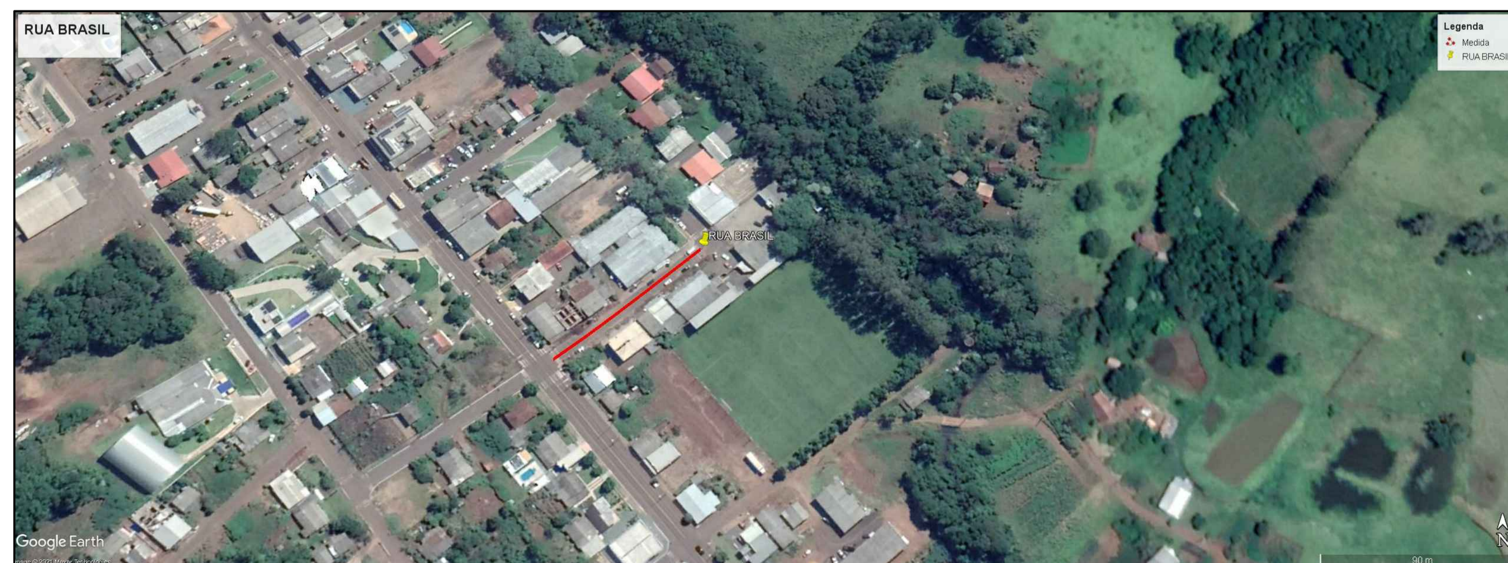
PLANTA DE LOCALIZAÇÃO Sem Escala