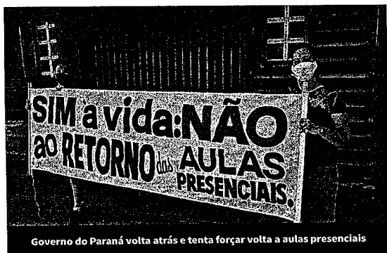
Gov. do Paraná volta atrás e tenta forçar volta a aulas presenciais

O artigo terceiro da nova resolução altera anterior também no que diz respeito às excepcionalidades para o teletrabalho. Agora, a Secretaria da Educação passa a figurar entre as que não podem autorizar teletrabalho, como já acontecia com as secretarias da Agricultura e Abastecimen-