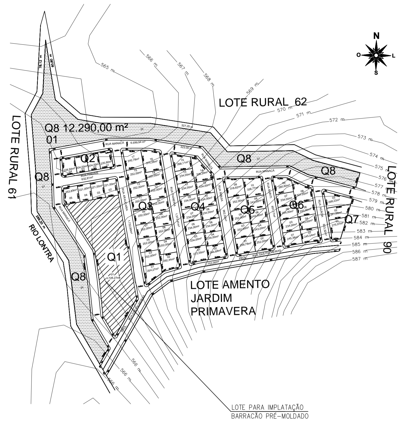
LOCALIZAÇÃO ESCALA 1:1000