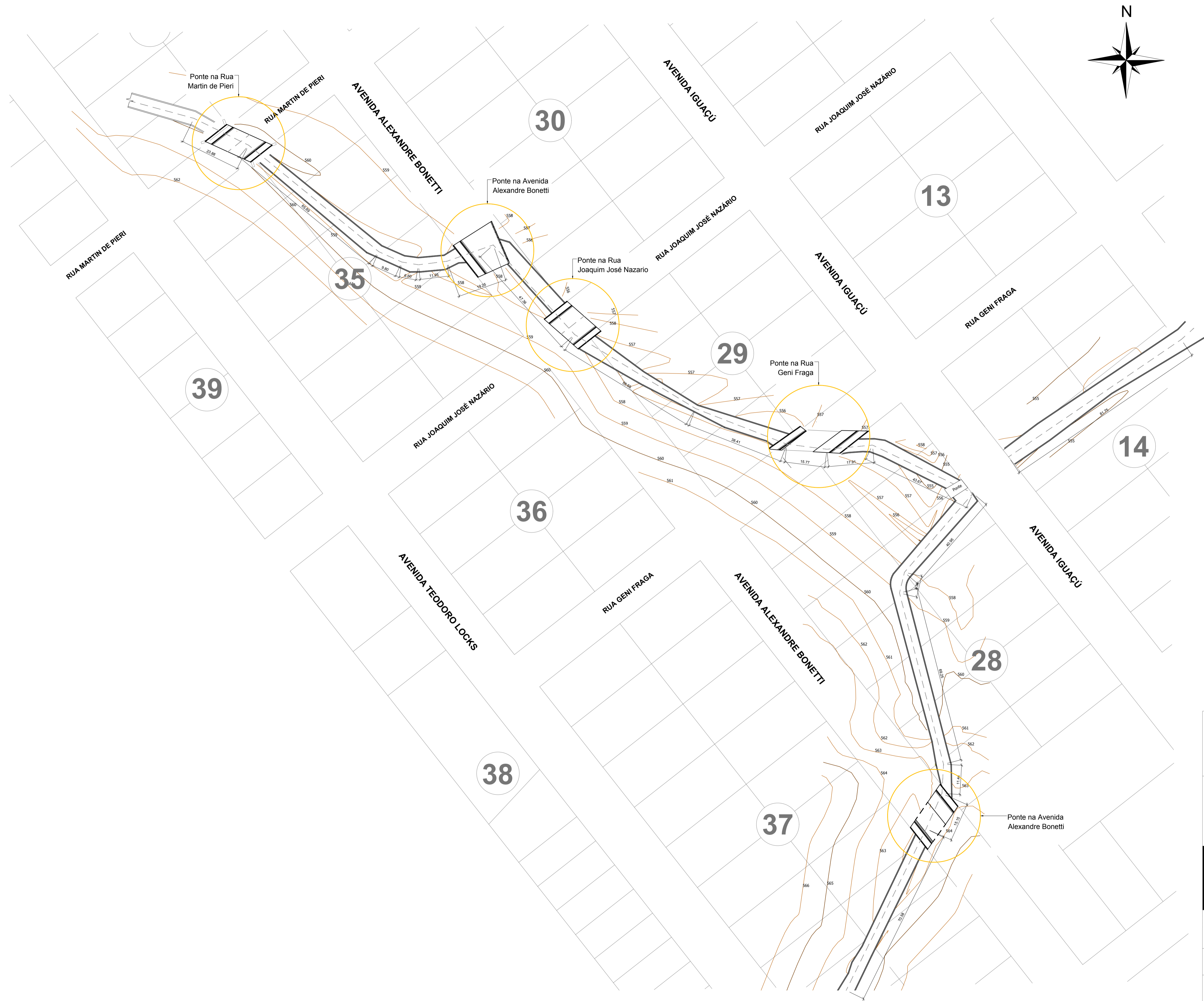
Levantamento Topográfico esc. 1/750