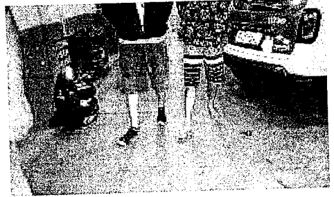
A situação ainda seria apurada, mas de acordo com a PM, eles podem ser autuados pelo crime de receptação. Fonte CGN

Dois jovens foram detidos na noite de terça-feira, em um hotel, em Santa Tereza do Oeste. A Polícia Militar recebeu uma denúncia que no local estava um veículo com registro de roubo e foi ao local para apuração. Chegando ao endereço, o Logan foi encontrado com o jovem de 18 anos e o adolescente de 16. Diante do flagrante, os detidos e o carro foram trazidos à Delegacia de Polícia Civil, em Cascavel.