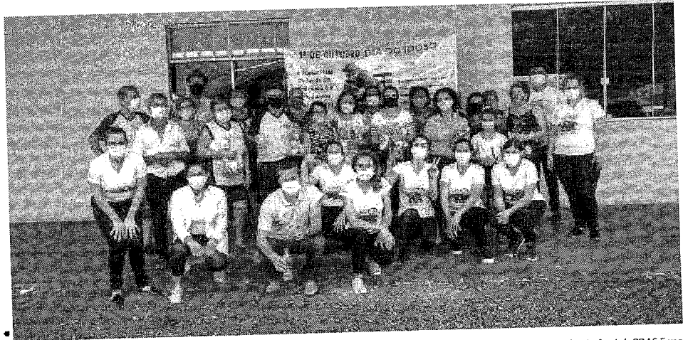
Secretaria de Assistência Social e CRAS, de Boa Esperança do Iguaçu, realizaram na quarta-feira, 30 de setembro, atividades antecipadas em comemoração ao Dia do Idoso - 1º de Outubro.