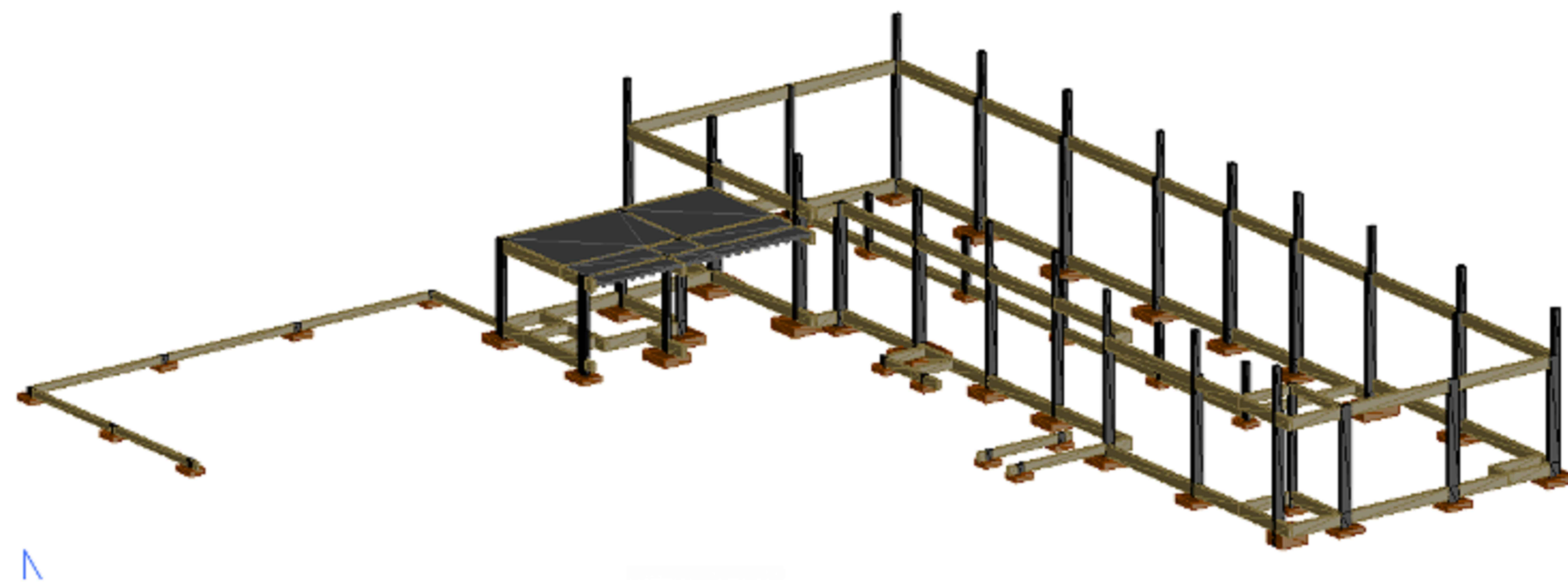
PLANTA ESTRUTURAL - 3D