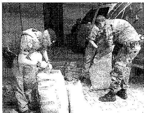
circunstanciado, além de terem sido multados com R$ 300 cada um. De acordo com a Polícia Ambiental, a comercialização de Pinhão estará liberada a partir de 1º de abril.

A fiscalização da Polícia Ambiental contou com apoio de uma equipe da PM de Clevelândia, que auxiliou nas abordagens. Os dois homens detidos no domingo foram autuados em um termo