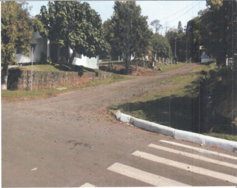
Foto 03 Rua Mazon